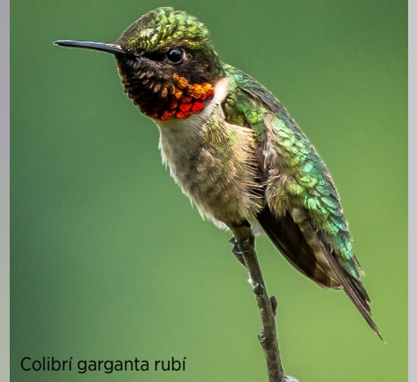
Colibrí garganta rubí